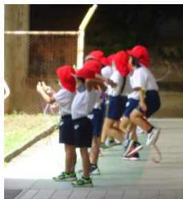
元気よく縄跳びの練習をしています