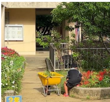
早朝から、花園の手入れ。すごいな