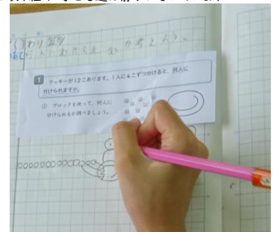
わり算 包含除 図にして 筋道立てて考えています