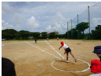
ソフトボール投げでいっぱい投げます