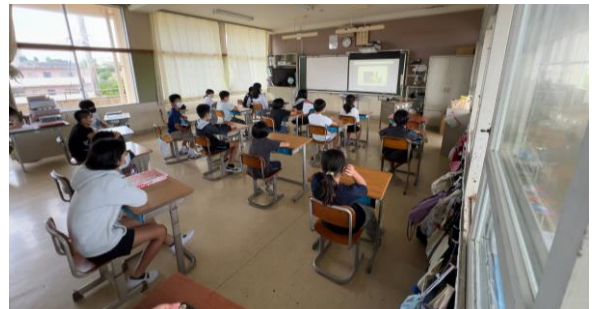
読み聞かせ「グリム」の取り組み 子ども達は静かに聞いています