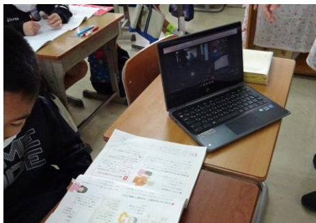
学級と自宅をつなぐ学びを止めない取り組み