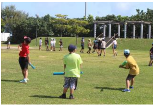
広い公園では、元気いっぱい動き回りました