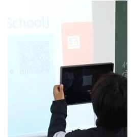
QRコードをPCで読み込み