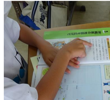
ていねいに読もうと指差して確認