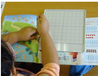
1対1対応 操作しながら数を学びます