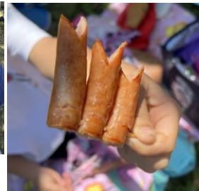
鯉のぼりウィンナー！すごいです