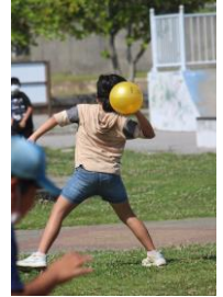
なかよくたのしく活動