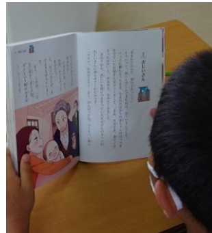
大好きな読書 読む力も高まります