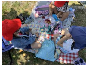
外で食べるお弁当 おいしそうです