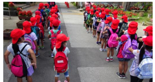
列を整えて、安全第一で出発の準備です！1年生