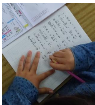
難しい漢字も一生懸命書きます