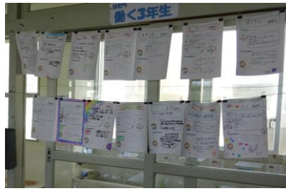
係活動もがんばります すてきな学級づくり