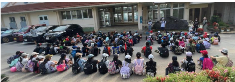
出発前。安全に気を付けて楽しむ等、事前のお話をしっかりきく高学年のみなさん

4月28日(木)に春の遠足を行いました。最高の天気となった春の遠足でした。子ども達は楽しいひとときを過ごしたようです。愛情たっぷりのお弁当もおいしそうにいただいていたいました。