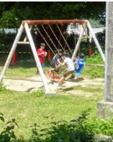
仲良く遊んで欲しいです