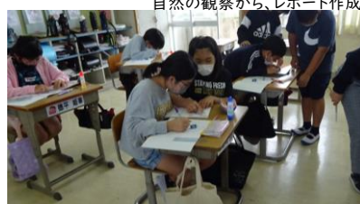
考え方をアドバイスする5年生