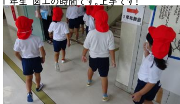
体育の授業へ 楽しそうです