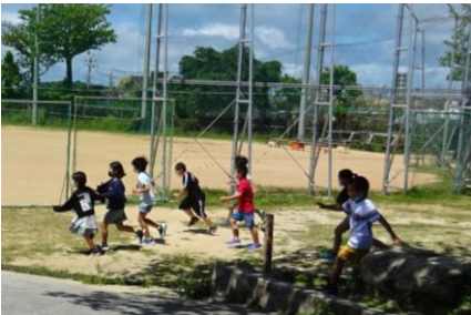
久しぶりの長休みです 安全を第一に、思い思いに過ごしています