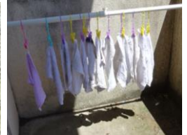
雑巾がきちんと干されています