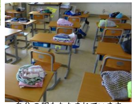
自分の服もたたまれています