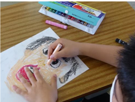
1年生 図工の時間です。上手です!