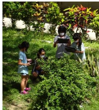
自然の観察から、レポート作成→