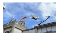
元気な鯉のぼりです