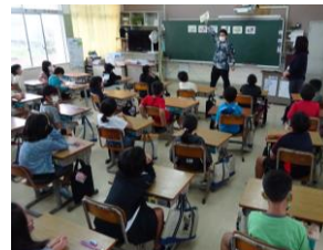
3年生も元気よく学習しています