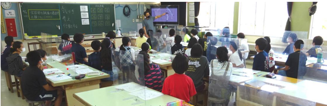
理科の様子。自分の考えを持ち、しっかり書き、すばらしい学習態度の6年生。さすがです!