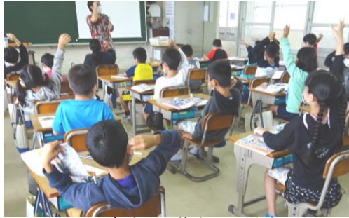
みんな意欲的に挙手しています