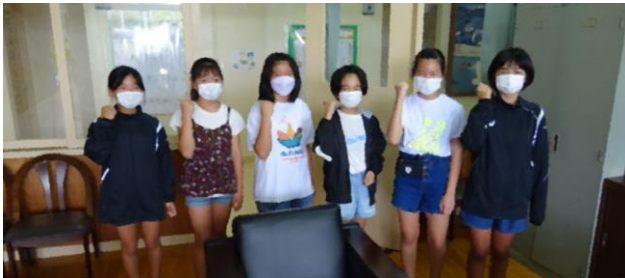
バレー部の6年生。練習試合で全勝したことの報告がありました。