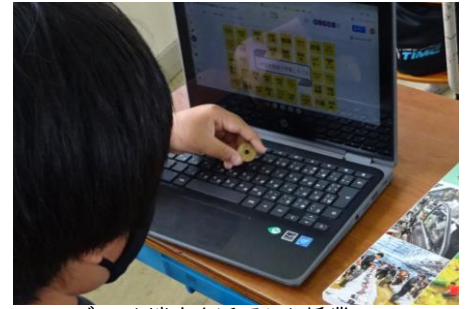
タブレット端末を活用した授業