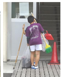
工夫して、考えて、相互に相談したりしながら清掃します。素晴らしい!

本校では「あいさつ、返事、後始末」「人を大切にすること」「勇気づけのボイスシャワー」をキーワードに掲げて指導しています。子ども達には具体的な言葉で説明し、さらに各月の生活の目標をかがけ、日常的に取り組めることを目標にしています。