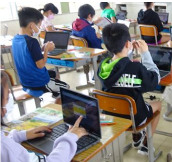
具体物を見て、考えを打ち込みます