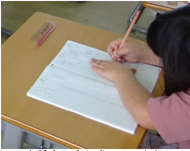
一生懸命丁寧に書いています