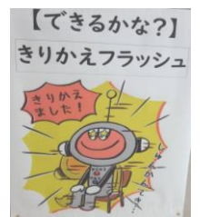
めりはりは大事です。