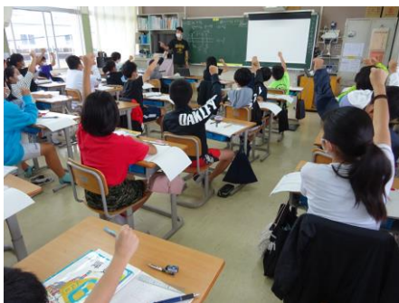
グーやチョキで自分の意思表示する機会がある授業