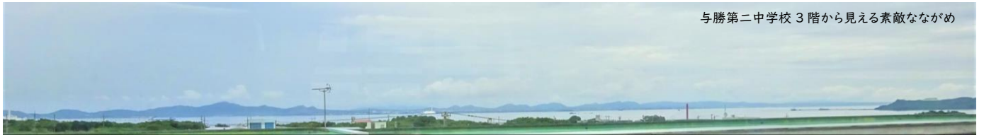
与勝第二中学校 3階から見える素敵なながめ

SEL-8S 学習プログラム(Social and Emotional Learning of 8 Abilities at School)は、社会性と情動の学習で、社会的能力を効果的に育成できるように工夫した学習プログラムです。