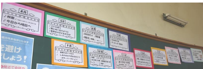
歌声いっぱいの平敷屋小学校。各月の歌が一目で分かる掲示物です。そして、子ども達のめあて「姿勢、口の形、明るい表情!