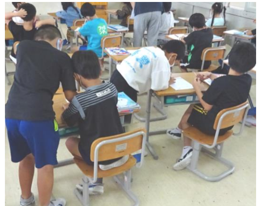
自分が理解したら、他の子にもやり方を教えています。すごい2年生